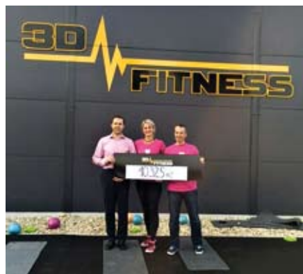
Na fotografii je úctyhodná částka 10.325 Kč, kterou 3D Fitness Žamberk podpořilo aktivity LPR.

s nejdůležitější akcí Ligy proti rakovině, ale zároveň jsme se rozhodli pomoc neomezit pouze na jediný den. Po celý květen věnujeme 5 korun z každého realizovaného nákupu v našem e-shopu a také z každého vstupu do studia v Žamberku na konto Ligy proti rakovině Praha. Růžová středa byla úžasná, moc se povedla a jsme za to rádi, ale jedeme dál,“ připomíná Nela.