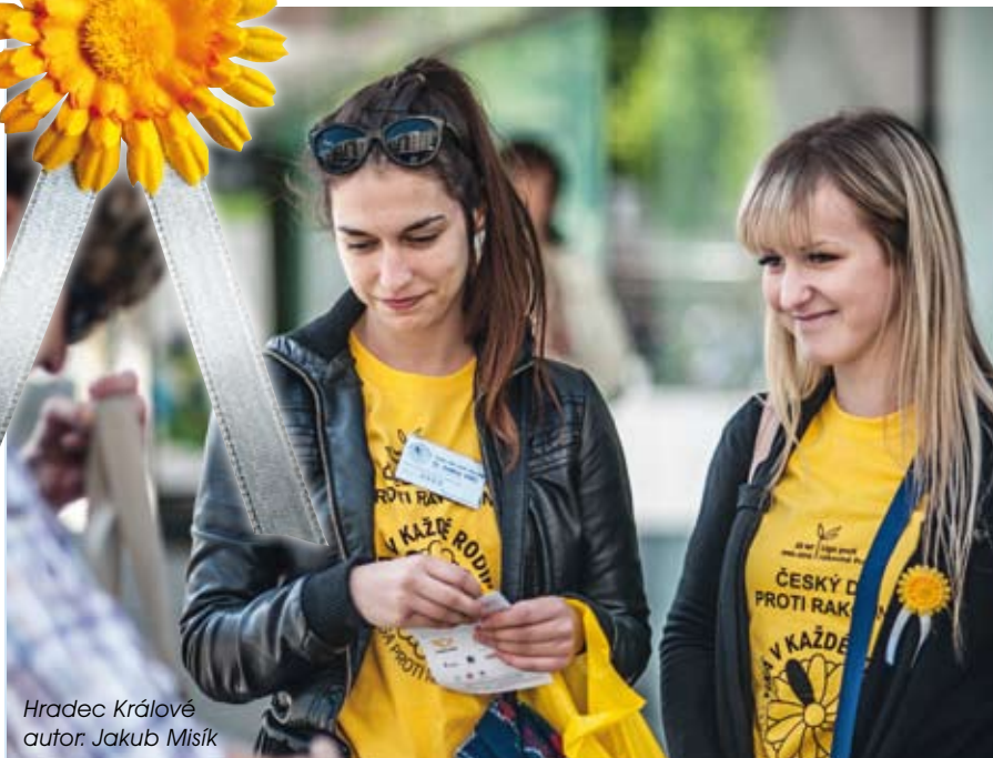
Hradec Králové

Dovolte, abychom upřímně poděkovali sponzorům, sdružením, svazům, školám, spolkům i jednotlivcům za jejich podporu a pomoc při letošní sbírce Český den proti rakovině.