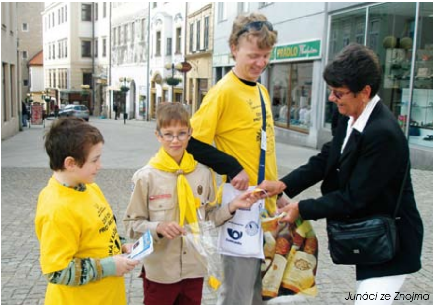
Junáci ze Znojma

Závěrem přijmeme upřímné poděkování nás organizátorů všem, kteří se na úspěchu Českého dne proti rakovině 2015 nadšeně a zdarma podíleli – děkujeme tisícovce koordinátorů sbírky a každému z více než 13.000 dobrovolníků, kteří ve žlutých tričkách vyrazili do ulic – školám středním, základním i mateřským, pionýrům, junákům, dobrovolným hasičům, členům ČČK a ČŠZ, firmám, obcím, knihovnám, zájmovým sdružením i jednotlivcům – a pochopitelně vám, všem členům Ligy a členských patientských organizací!