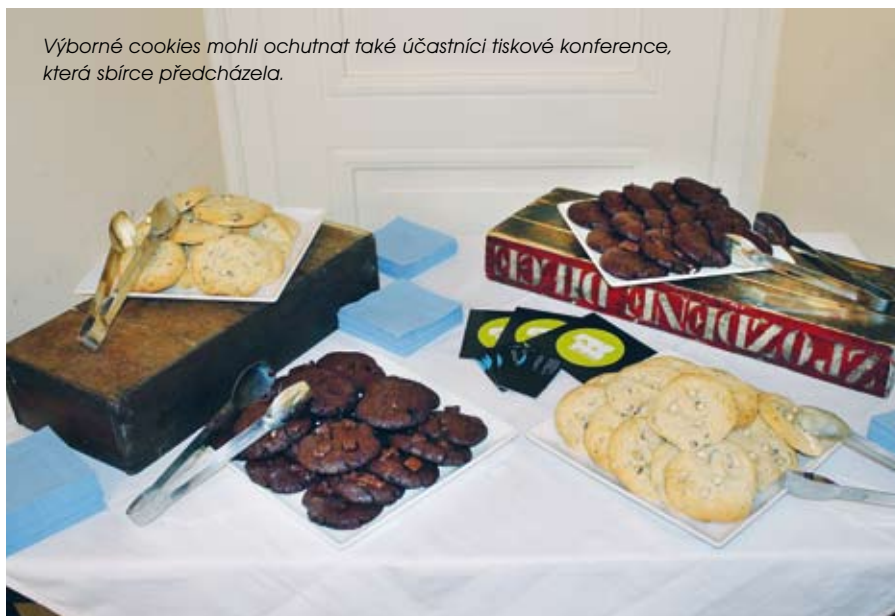
Výborné cookies mohli ochutnat také účastníci tiskové konference, která sbírce předcházela.