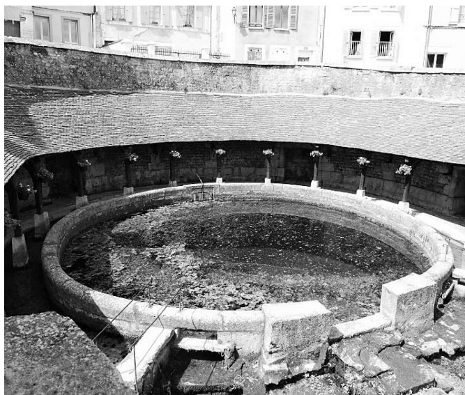
La Fosse Dionne

Pak prcháme do Sens, kde svítí sluníčko, ale fičí vítr. Opět další porce katedrály a pak jízda do Orleans. Těším se na něco dobrého k večeři. A skleničku burgundského.