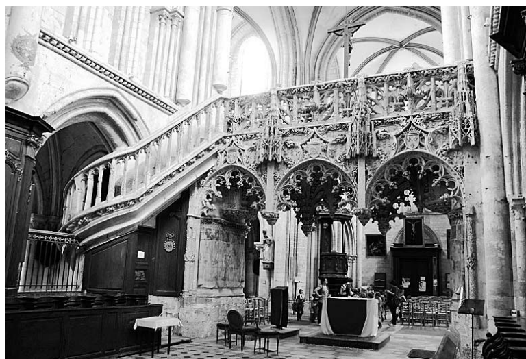
Interiér kostela St. Madeleine

Další rozkošné město je Troyes. Věvodí mu kostel sv. Urbaina; staré město je rozlehlé, s hrázděnými domy; částečně rekonstruované gotické jádro města s původní dispozicí domů, uliček, chodníků a zahrad za domy, kde ve středověku bývalo hospodářství. V hrázděných domech jsou dílničky, obchody, běžné služby (kadeřník), galerie, uprostřed z prostranství po zaniklých dvorech zahrada knihovny. Ve středověkém dvoře, odpovídajícím asi pražskému Ungeltu a majícím kdyś stejnou funkci, sídlí část úřadovny Evropských architektonických studií, které zřejmě tuto středověkou lokalitu zachránily a začlenily do živoucího města. Katedrála St. Pierre et Paul – vrcholná gotika, pět loží, jinak podobná sv. Vítu. Jdeme dál úzkou uličkou a najednou jsme na předělu starého a nového města a krásně to na sebe navazuje. Univerzita sídlí v renesančním