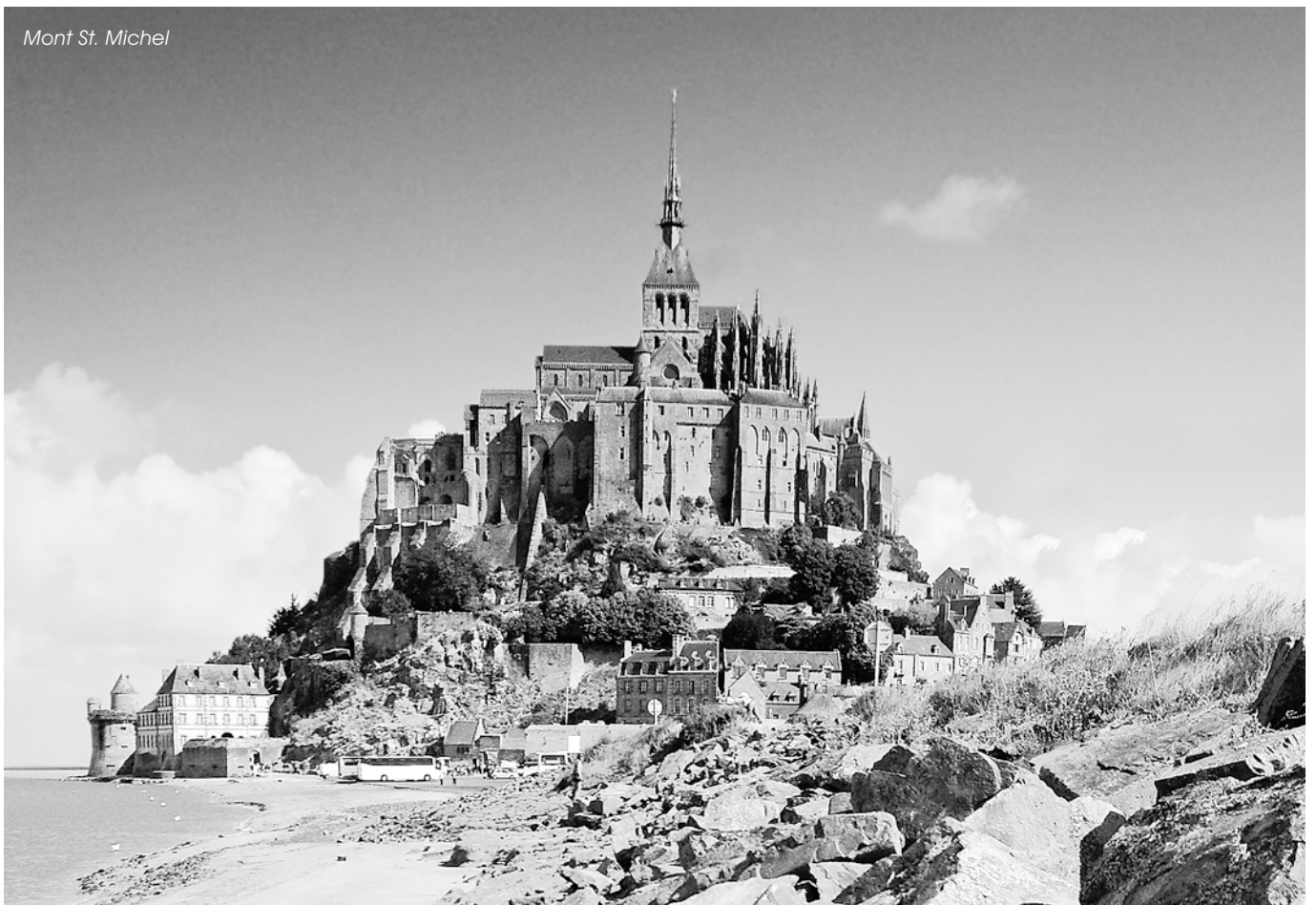
Mont St. Michel

Červnová Francie má dvě velké výhody: nejsou ještě prázdniny a není vedro. To, že nejsou prázdniny, je příjemné, lidé pracují, děti chodí do školy a památky, kostely, zámky a zahrady