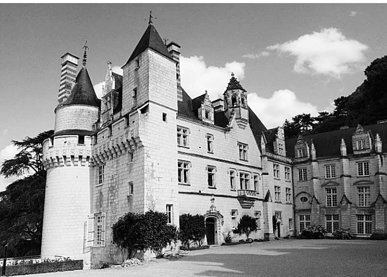
Nádvoří zámku Ussé

a kláštera s kostelem. Je červen, největší příliv je v noci v 21 nebo 22 hodin. Teď dopoledne je úzká šíje mostu spojující ostrov s pevninou jen předěl mezi mořem písku vpravo a mořem písku nalevo. Zákaz chození nebezpečnou písčinou porušuje dvojice svatebčanů s fotografem, uprostřed písčité pláně fotí působivé svatební foto. Obcházíme město na skále, klášter, katedrálu. Musíme se spokojit s textem v angličtině a velmi litujeme, že neumíme francouzsky. Skupinu lidí vede průvodce, vypadá na učitele, usazuje skupinu v katedrále do lavic a vykládá. Nesmírně temperamentně, obsírně a zřejmě velice poutavě, každou chvíli se pod klenbou rozlehne burácivý smích. Cloumá mnou zvědavost a vyčítám si lenost a hloupost. Bylo tolik času naučit se slušně zdejší jazyk! Možná příště už budu rozumět.