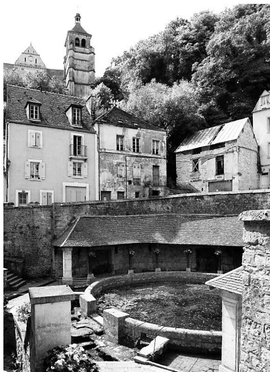
Tonnerre - La Fosse Dionne

penému květinami. Vlídne slečny v pokladně mluví slušně anglicky a svůj zámek mají opravdu rády. Chenonceau. Je překrásný, říká se mu zámek šesti žen, postavil ho pokladník některého z Ludvíků pro sebe a svoji paní a po 33 letech opět připadl koruně. Jak, to nevím, nejspíše odúmrtí nebo nemilostí. Nicméně ho Jindřich II. daruje své favoritce Dianě z Poitiers. Co by ne, má s ní několik dětí a doma Kateřinu Medicejskou, která nevypadá, že by měla smysl pro humor. Když Jindřich zemře v souboji, Kateřina Medicejská donutí Dianu vyklidit pole a vrátit zá-