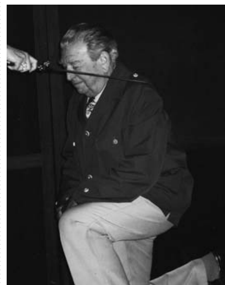
Slavnostní zařazení do Klubu kmetů se neobešlo bez mysliveckých fanfár, symbolického pasování a předání „vzácného úlovku“