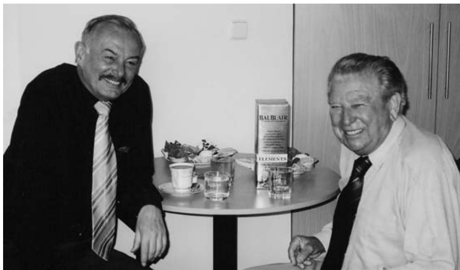
Osobně přišel jubilantovi popřát předseda Senátu Parlamentu ČR Přemysl Sobotka

řádným výkonům. Tvoji práci jsem vždy obdivoval a považoval Tě za vzor pro nás mladší. Děkuji Ti i jménem České onkologické společnosti ČLS JEP za vše, co jsi pro onkologii udělal a ještě uděláš.