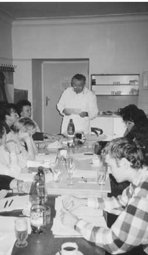
Ze zasedání výboru LPR Praha

kles spotřeby vepřového a hovězího a vzrůst spotřeby kuřecího masa. U vepřového je pokles o 5 kg, u hovězího o 4 kg a vzestup u kuřecího masa je 7 kg na osobu a rok.