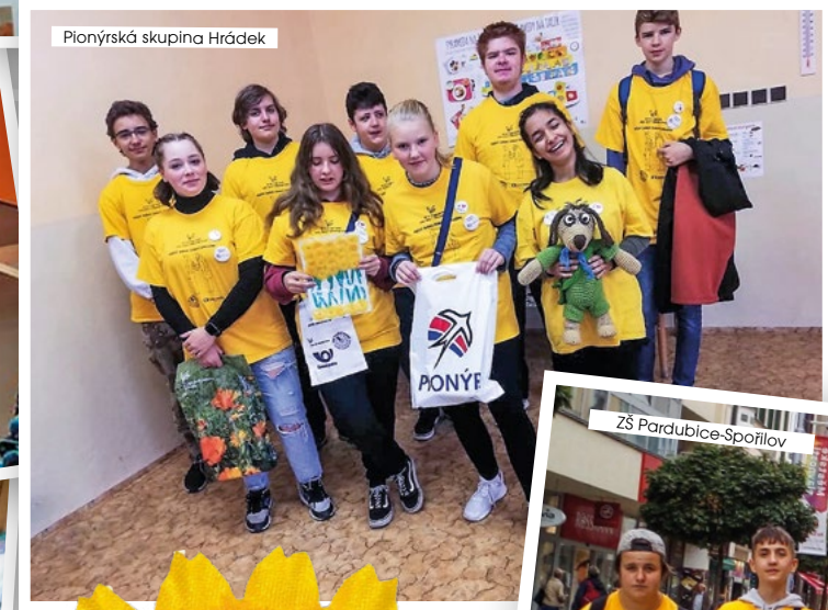
Pionýrská skupina Hrádek