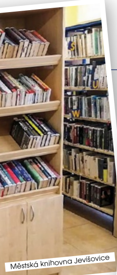
Městská knihovna Jevišovice