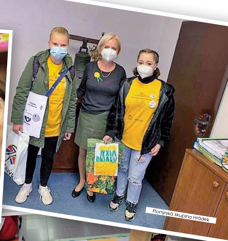
Pionýrská skupina Hrádek