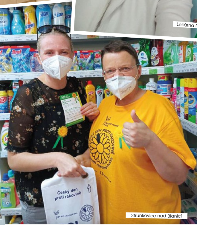
Strunkovice nad Blanicí