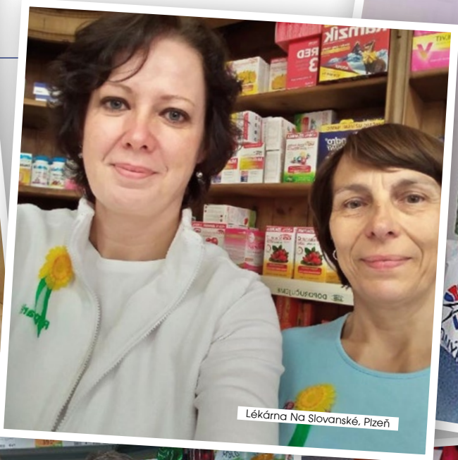
Lékárna Na Slovanské, Pízeň