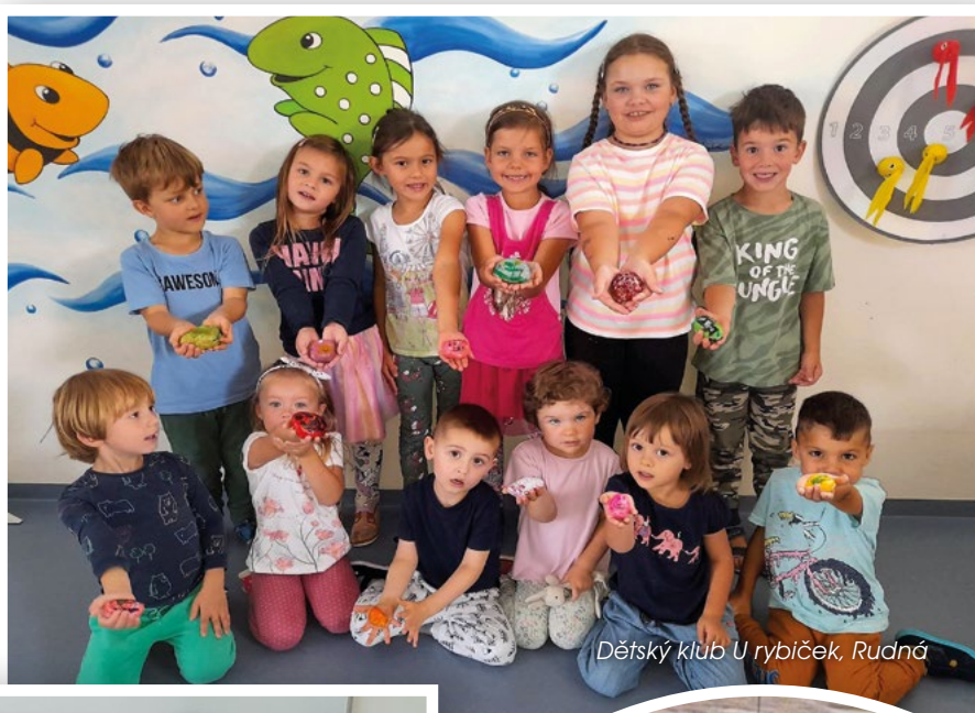
Dětský klub U rybiček, Rudná