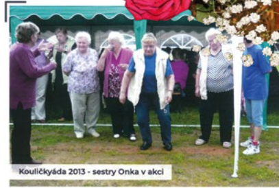
Kuličkýada 2013 - sestry Onka v akci

I naším prvním projektem v roce 2003 bylo natočení videokazety ve spolupráci se zdravotním ústavem s názvem „My ženy“ právě o rakovině prsu. Získali jsme podruhé naši klubovnu a nebylo to jednoduché. Scházeli jsme se zpočátku v restauraci, ale zázemí jsme měli po sklepích a skladech. I letos jsme získali opravdu nádhernou, snad již poslední klubovnu, i stěhování bylo dost příjemné.