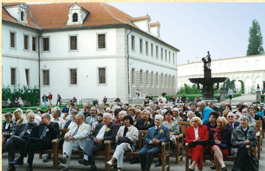
Valdštejnská zahrada, r. 2002

Začátkem r. 2001 proběhla Výroční členská schůze a v únoru se uskutečnilo společné jednání o taktice snah o omezení kouření. V dubnu uspořádala LPR víkendový seminář o genetice zhoubných nádorů na Pleši. Koncem tohoto měsíce se konal Veletrh léčiv a lékařské techniky Pragomedica, kde měla Liga opět svůj samostatný stánek a nabízela propagační a edukační materiály. V polovině května, ve středu 16. 5., již tradičně proběhl V. Květinový den na téma kouření u žen a u příležitosti této veřejné sbírky se konal Děkovný koncert ve Vojanových sadech v Praze. Dne 22. 5. jsme uspořádali v Divadle J. Grossmanna ve spolupráci s tímto divadlem koncert, který byl věnován především pacientům s Hodgkinovou nemocí. Název koncertu byl velmi výstižný – „Dneska by Grossmann možná žil“. Tato akce byla věnována 75. narozeninám prof. MUDr. Z. Dienstbiera, DrSc., a prof. MUDr. E. Skaly, CSc. Na podzim se opět sjeli zástupci kolektivních členů LPR na tradiční sněm.