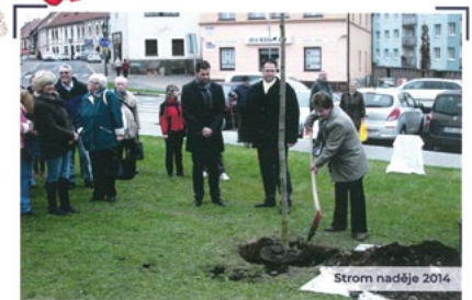
Strom naděje 2014