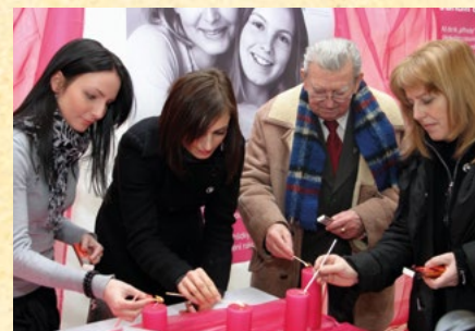
Týden prevence karc. děl. čípku, r. 2009