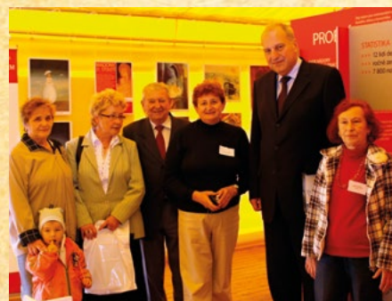
Putovní výstava v Ostravě, r. 2008

Začátek roku 2008 patřil tiskové konferenci v Akademickém klubu 1. LF UK ve Faustově domě a únor byl ve znamení konání sympozia ke Světovému dni proti rakovině ve spolupráci ČLS, Českou onkologickou společností a Společností všeobecného lékařství JET, tématem byla „Nádorová prevence“. V květnu se konala tisková