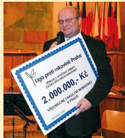
Grant udělený Všeobecné fakultní nemocnici v Praze, r. 2009

Děkovný koncert se konal v Betlémské kapli pod záštitou rektora ČVUT. V září a říjnu se uskutečnil II. ročník úspěšné Putovní výstavy „Každý svého zdraví strůjcem“ a v prosinci jsme zorganizovali vánoční koncert v Karolinu, kde byli vyhlášeni držitelé Vědecké ceny LPR Praha, byla udělena Novinářská cena a poprvé i Cena pro neaktivnější a nejuspěšnější onkologický klub v rámci sbírky v r. 2009. Jak vidíte, Liga byla i v této dekádě