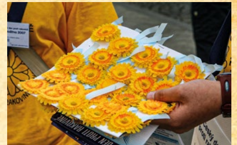
Český den proti rakovině, r. 2007

Tisková konference ke Světovému dni proti rakovině se konala koncem ledna 2007 v Jindřišské věži v Praze 1. Světový den proti rakovině byl 4. února poprvé zařazen mezi pravidelné akce LPR. V polovině května proběhla tisková konference, tentokrát v Nemocnici Na Homolce v Praze 5, a několik dní poté se uskutečnil XI. Český den proti rakovině. Název byl změněn v soula-