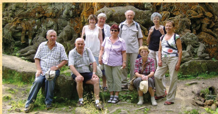
Liga proti rakovině Hradec Králové, r. 2002