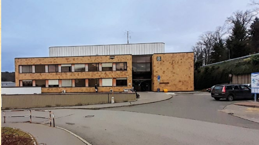
Nemocnice Na Bulovce, Ústav radiační onkologie, sídlo Ligy od r. 2005

Rok 2005 byl jako každoročně zahájen výroční členskou schůzí LPR Praha.