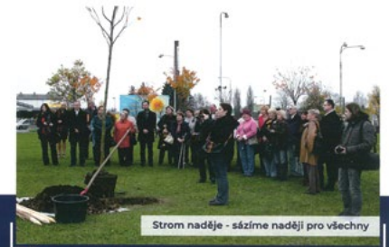
Strom naděje - sázíme naději pro všechny