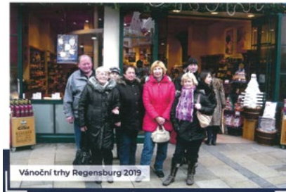
Vánoční trhy Regensburg 2019