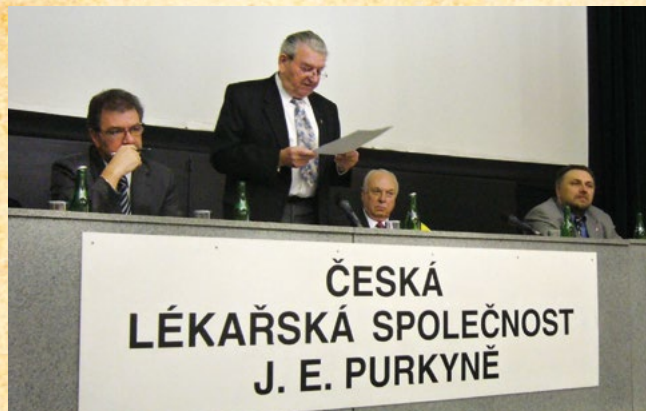
První odborné sympozium ke Světovému dni proti rakovině, r. 2008

Začátek roku 2008 patřil tiskové konferenci v Akademickém klubu 1. LF UK ve Faustově domě a únor byl ve znamení konání sympozia ke Světovému dni proti rakovině ve spolupráci ČLS, Českou onkologickou společností a Společností všeobecného lékařství JET, tématem byla „Nádorová prevence“. V květnu se konala tisková